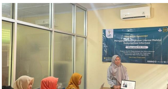
Gambar 1. Sharing Session tentang Literasi yang ada di Masyarakat Demangrejo

Sebelum kegiatan advokasi berlangsung, pengelola perpustakaan desa Demangrejo dan masyarakat desa Demangrejo memberikan cerita beberapa pengalaman terkait literasi informasi di desa Demangrej, hal ini dilakukan untuk melihat sejauh mana tingkat literasi informasi masyarakat melalui dokumentasi informasi. Kegiatan ini dilaksanakan pada tanggal 07 Maret 2024 09.00 WIB – Selesai di Ruang rapat Desa Demangrejo, Kulon Progo, D.I Yogyakarta. Setelah sesi diskusi atau sharing pengalaman mengenai literasi di masyarakat Demangrejo, didapatkan masih banyak masyarakat dan pustakawan yang masih kurang paham dalam dokumentasi informasi.