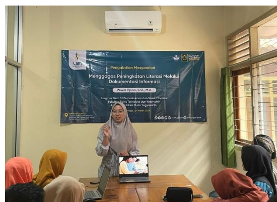
Gambar 2 : Peserta Menyimak Materi Pelatihan dari Narasumber

Sebelum kegiatan advokasi berlangsung, pengelola perpustakaan desa Demangrejo dan masyarakat desa Demangrejo memberikan cerita beberapa pengalaman terkait literasi informasi di desa Demangrej, hal ini dilakukan untuk melihat sejauh mana tingkat literasi informasi masyarakat melalui dokumentasi informasi. Kegiatan ini dilaksanakan pada tanggal 07 Maret 2024 09.00 WIB – Selesai di Ruang rapat Desa Demangrejo, Kulon Progo, D.I Yogyakarta. Setelah sesi diskusi atau sharing pengalaman mengenai literasi di masyarakat Demangrejo, didapatkan masih banyak masyarakat dan pustakawan yang masih kurang paham dalam dokumentasi informasi.