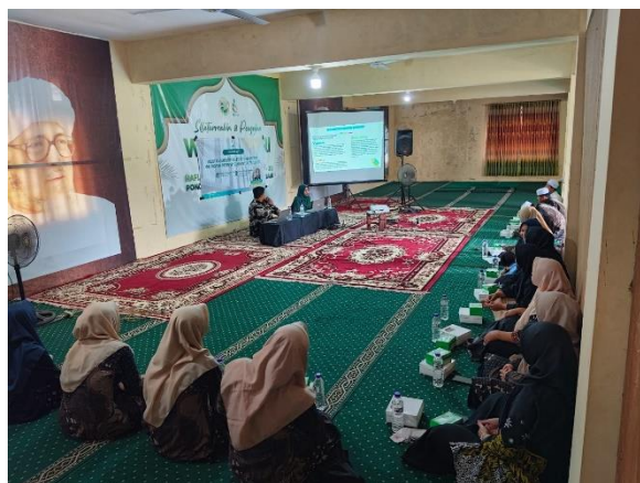
Gambar 2. Pemaparan materi pengajaran bahasa Inggris di tingkat dasar

Materi disajikan oleh pemateri yakni dosen pendidikan bahasa Inggris UIM Yogyakarta, yang menyampaikan pemaparan dengan menggunakan PPT. Materi pembuka adalah tentang status bahasa Inggris di SD di Indonesia yang sebelumnya adalah muatan lokal, kemudian menjadi tidak menentu pada kurikulum 2013, dan beralih menjadi wajib di Indonesia pada tahun 2027. Setelah itu para guru MI diberikan penjelasan tentang kebijakan pengajaran bahasa Inggris tingkat dasar di Vietnam, Jepang, dan Hong Kong.